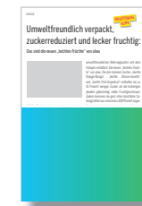
1/2 Seite Anzeige + 1/2 Seite Porträt