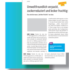
1/1 Seite Anzeige + 1/1 Seite Porträt

ACHTUNG: Anzeigenmotive müssen mit Beschnitt angelegt werden. Die Druckunterlage darf aber keine Schnittmarken/Trimbox enthalten.