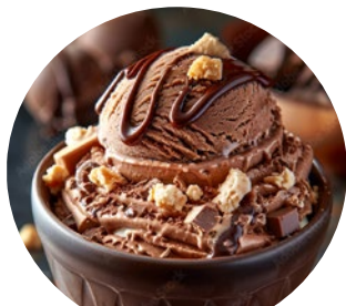
LA DOLCE VITA

Location: Seestraße 6 73733 Esslingen am Neckar www.ladolcevita.de