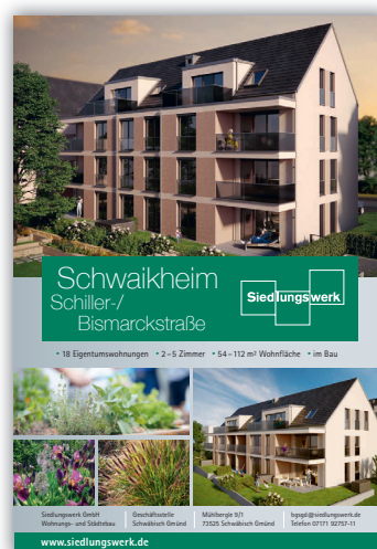
Beispiel Imageanzeige 1/1 Seite