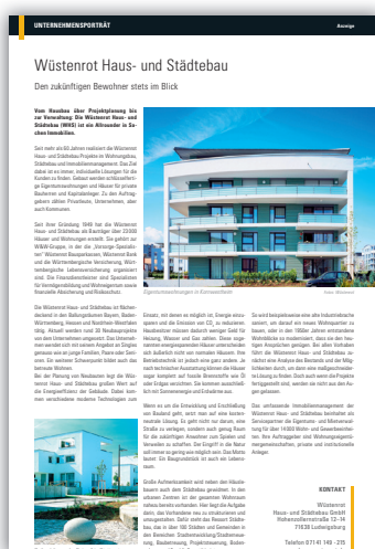
Beispiel Unternehmensporträt 1/1 Seite

Redaktionelle und klassische Werbeformen – jetzt auch online!