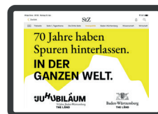
Querformat: 2.048 x 1.532 px

Dateigröße max: 400 KB Dateiformat: JPG, PNG mindestens 150 Pixel Freiraum ober- & unterhalb der Werbebotschaft