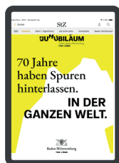
Hochformat: 1.532 x 2.048 px